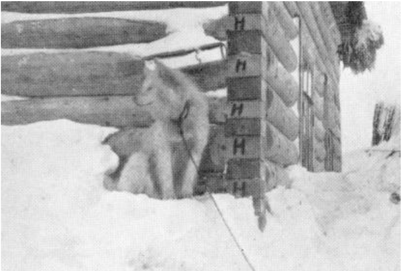
Jackson's Nimrod op berenwacht.