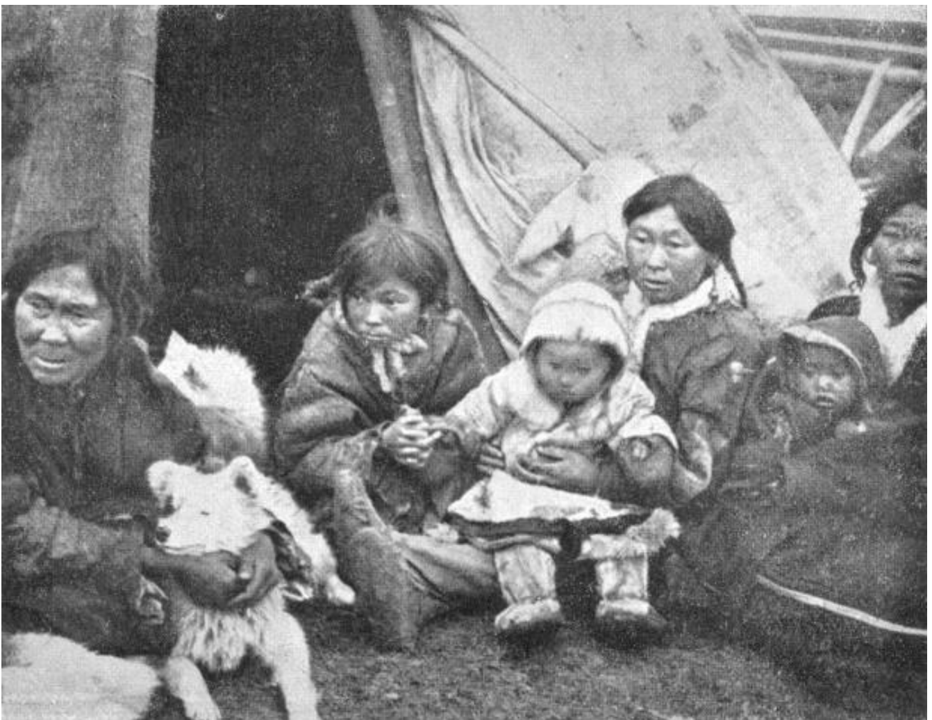
Jenissei-Samojeden voor de tent