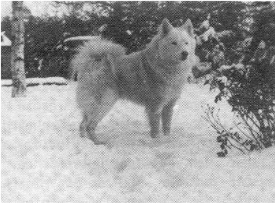
Farningham Ikon in de sneeuw, stamvader van de Nederlandse samojeden