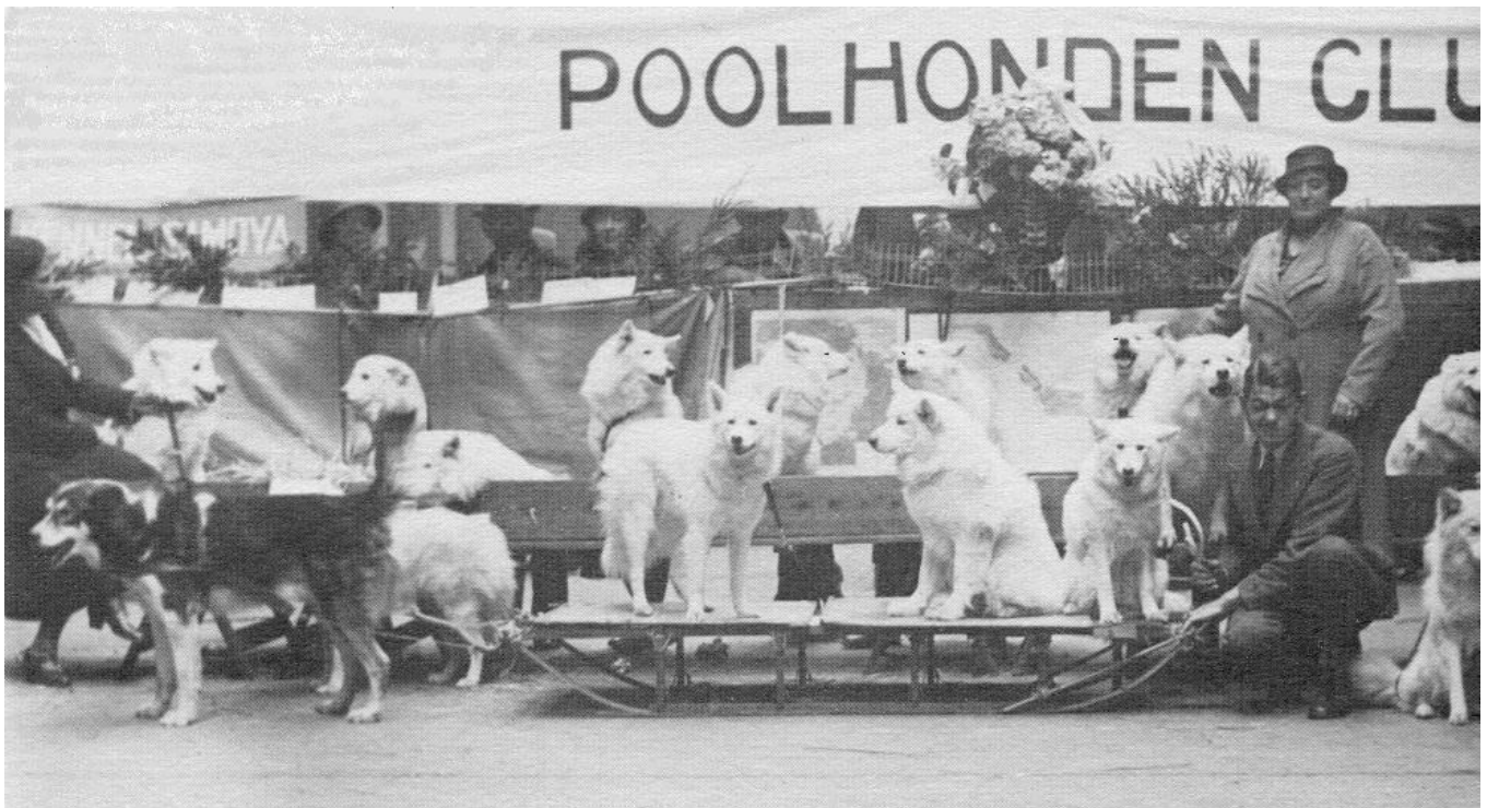
1933 De Nederlandse Poolhonden Club presenteert zich op de Winner

In het periodiek "Onze Poolvrienden" van juli 1939 deelt de heer Spaapen de leden het volgende mee: Wellicht zal het de leden der samoeden-afdeling bekend zijn, dat -ingevolge de goedkeuring door den Raad van Beheer van ons genomen besluit op de Jaarvergadering in januari j.l.- het ras der Huskies voortaan door de PHC "in bescherming wordt genomen". Dit laatste klinkt wat vreemd doch het beduidt niet anders, dan dat de PHC ook de belangen van het Huskyras zal behartigen." Inmiddels was de clubnaam dus veranderd van Samoeden Club in Poolhonden Club, met hierin een Samoeden- en een Husky-afdeling.